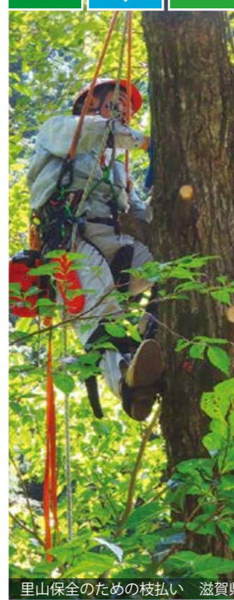
里山保全のための枝払い 滋賀県

森林の活力を支えるため、植樹や下刈り、間伐などを地域住民とボランティアの人々が一緒になって行っています。