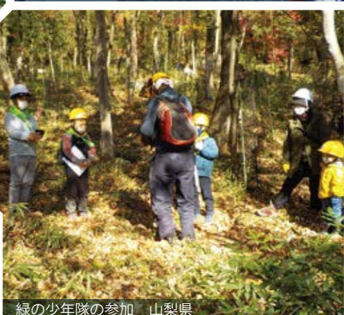
緑の少年隊の参加 山梨県