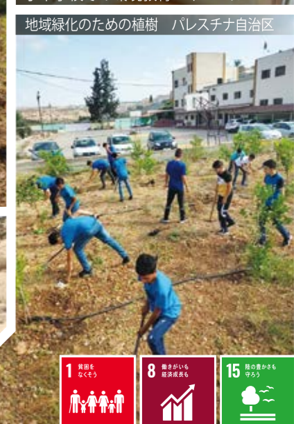
地域緑化のための植樹 パレスチナ自治区