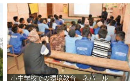
小中学校での環境教育 ネパール