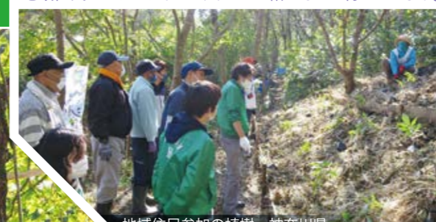
地域住民参加の植樹 神奈川県