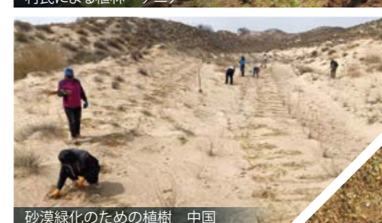
砂漠緑化のための植樹 中国