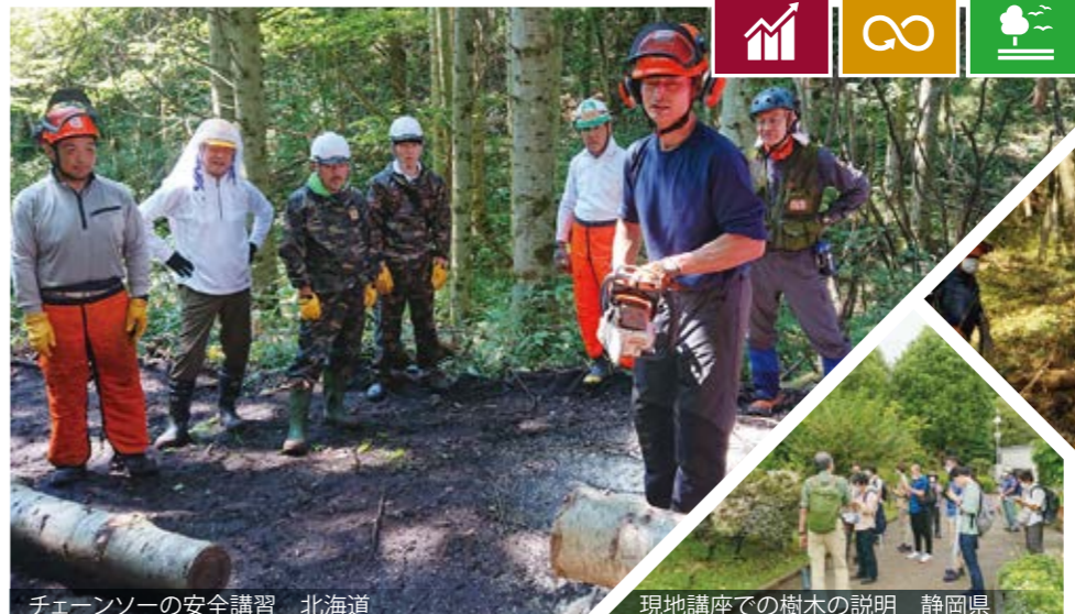
チェーンソーの安全講習 北海道