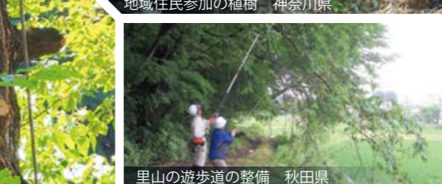
里山の遊歩道の整備 秋田県