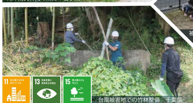
台風被害地での竹林整備 千葉県