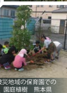
被災地域の保育園での園庭植樹 熊本県