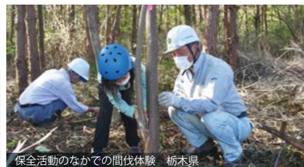
保全活動のなかでの間伐体験 栃木県