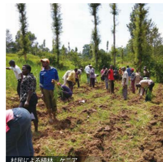
村民による植林 ケニア