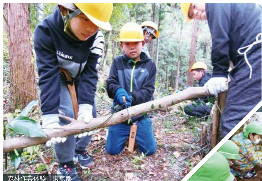
森林作業体験 東京都