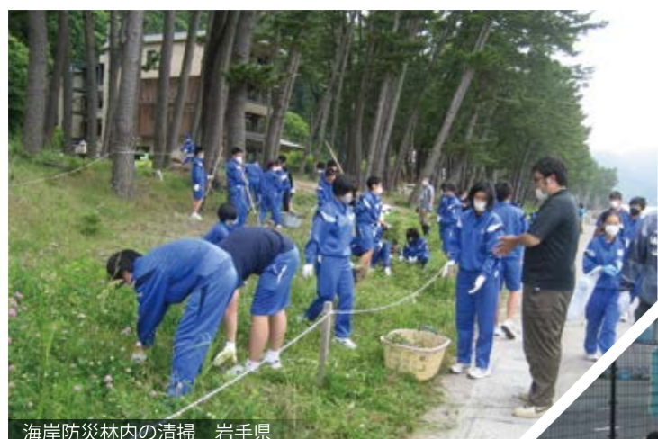
海岸防災林内の清掃 岩手県