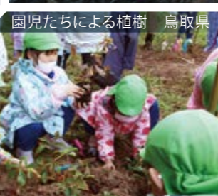
園児たちによる植樹 鳥取県