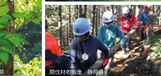
間伐材の搬出 静岡県