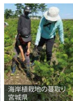
海岸植栽地の草取り 宮城県