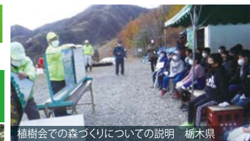
植樹会での森づくりについての説明 栃木県