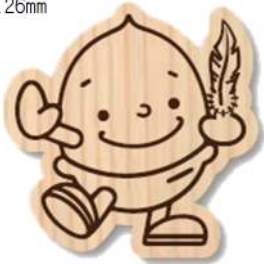
どんぐりくん マグネット