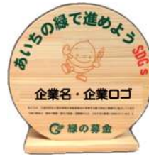
緑の募金協力プレート (イメージ)

(注) ① 同一の個人又は団体から同一年度内に2回以上の寄附があった場合には、その合計額をもって寄附の額とする。