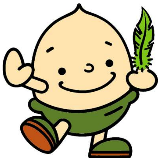
緑の募金アイドルキャラクター どんぐりくん