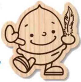
どんぶりくん マグネット