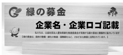
緑の募金協力プレート（イメージ）

(注) ① 同一の個人又は団体から同一年度内に2回以上の寄付があった場合には、その合計額をもって寄付の額とする。